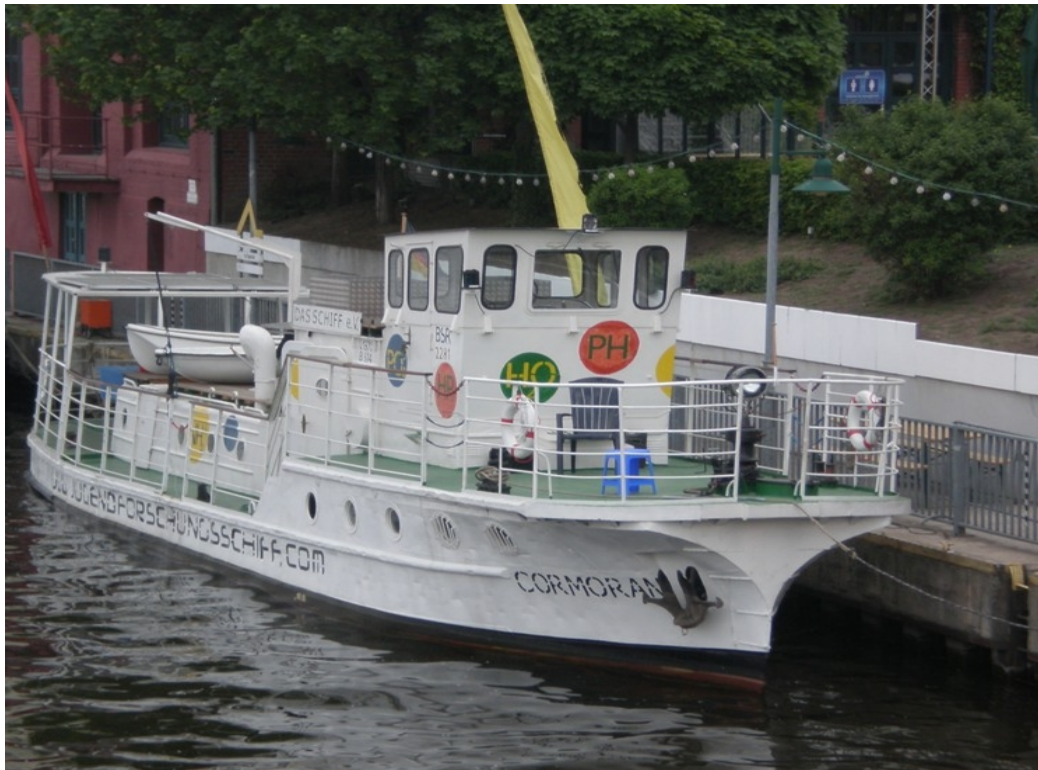
Das Jugendforschungsschiff an der Oberbaumbrücke