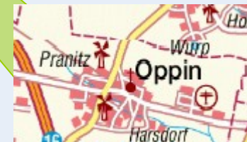
Behinderteneinrichtung „Siedlung am Park“ (Parität)