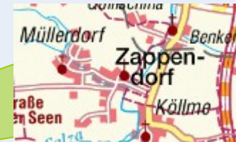
Landwirtschafts- und Heimatmuseum