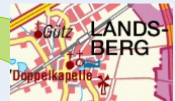
Stadt- und Schulbibliothek